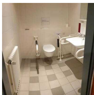
UG: Öffentliches WC für Menschen mit Behinderung