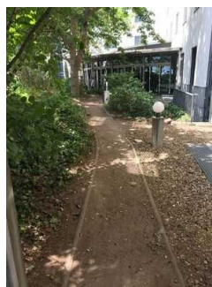
Stufenloser Außenweg zur Terrasse