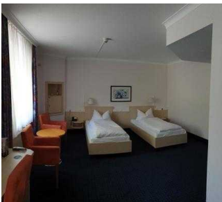
1. OG: Zimmer 133 mit Bad