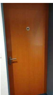
UG: Öffentliches WC für Menschen mit Behinderung