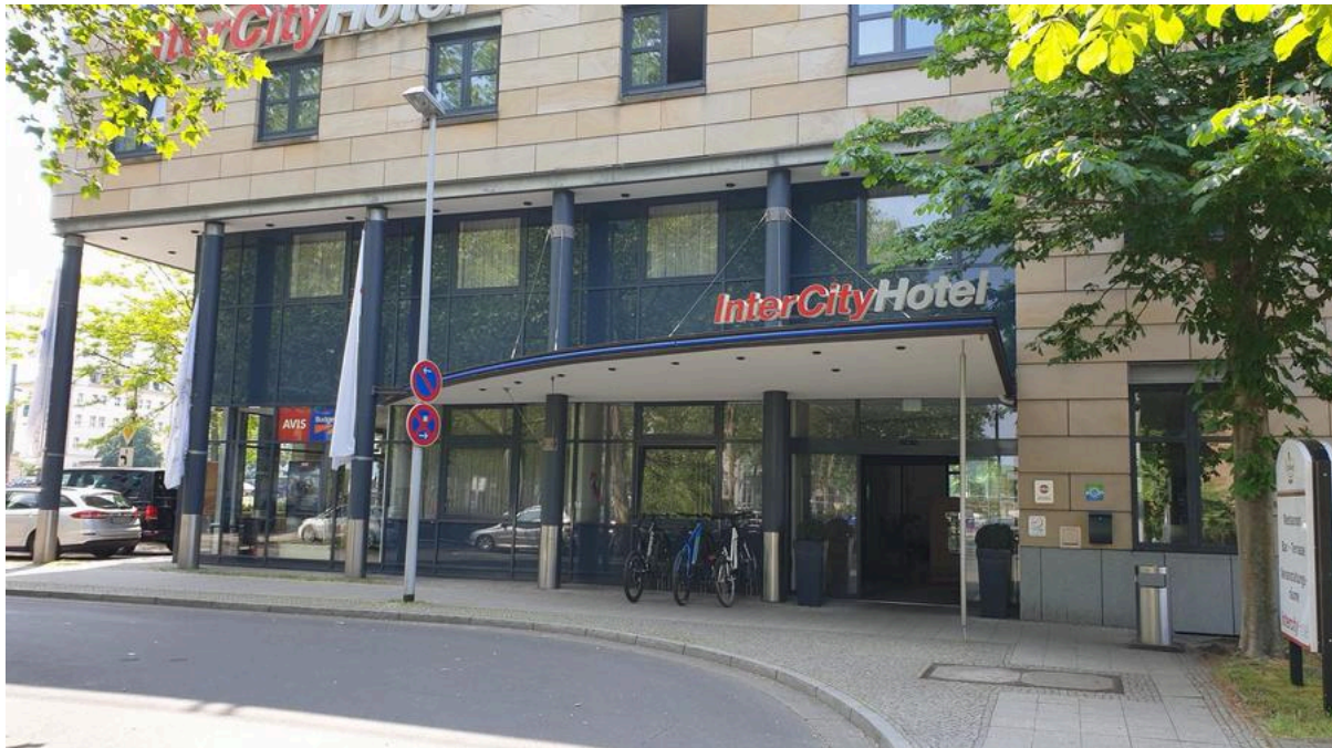
Intercity Hotel Magdeburg