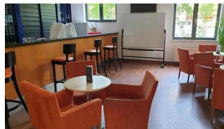
EG: Bistro in der Lobby