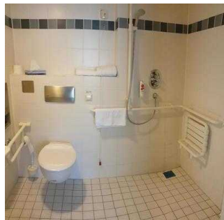
1. OG: Zimmer 133 mit Bad