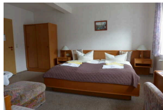
1. OG: Zimmer 3 mit Badezimmer