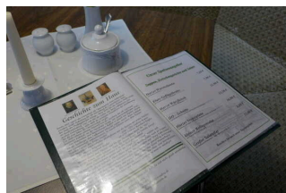
Allergien und Nahrungsmittelunverträglichkeit