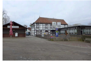
Restaurant-Pension „Gartenhaus“ Pansfelde