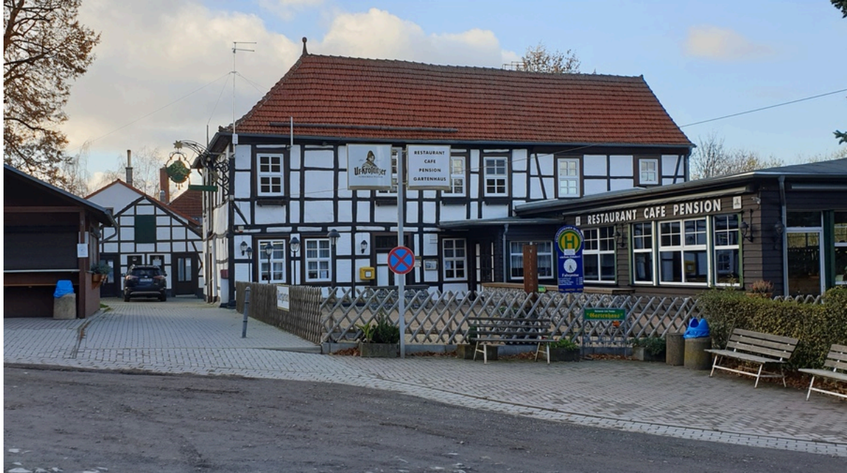
Restaurant-Pension „Gartenhaus“ Pansfelde