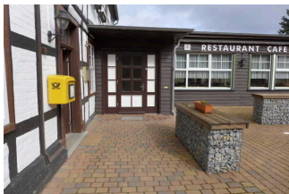
Eingang Restaurant und Pension