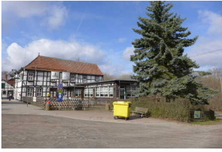
Restaurant-Pension „Gartenhaus“ Pansfelde