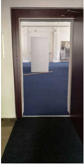
Eingang zur Kunsthalle