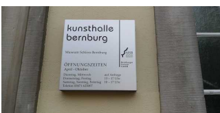
Mantelbogen visuell taktile Gestaltung