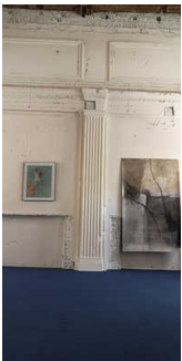
Ausstellungsraum/ weitläufiger Raum