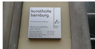
Kunsthalle Bernburg im Marstall