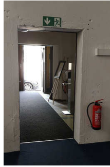
Flur vom Eingang zur Kasse und Kunsthalle