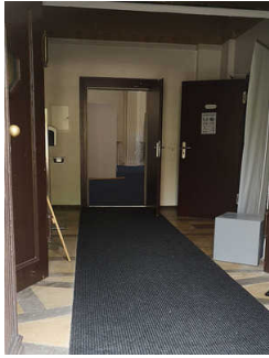
Flur im Erdgeschoss