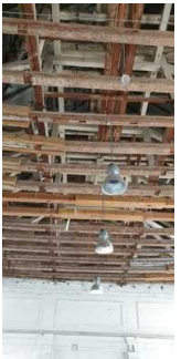
Beeindruckendes, freiliegendes Dachgebälk