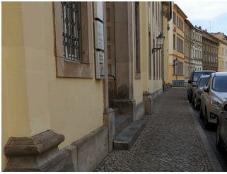
Parkplatz an der Straße vor dem Haus