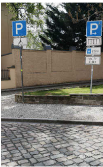
Öffentlicher Parkplatz am Rathaus