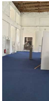
Kunsthalle als Ausstellungsraum