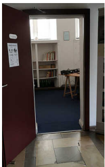
Eingang zum Kassenraum