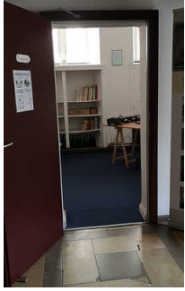
Kasse / Ticketschalter