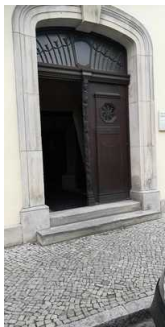
Kunsthalle Bernburg im Marstall