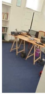
Kasse / Ticketschalter